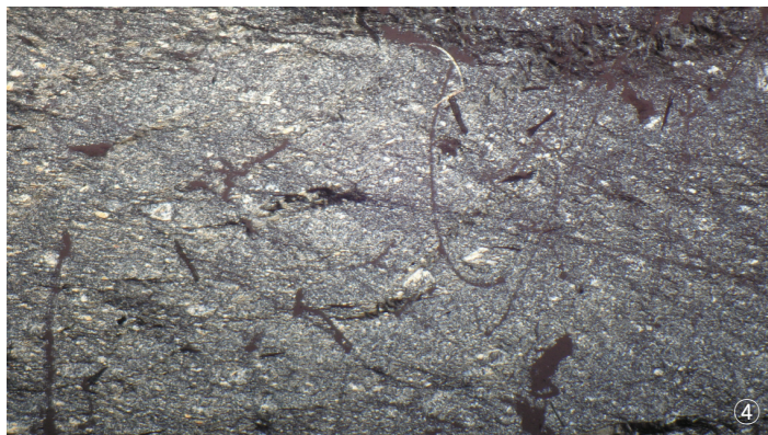
①노두사진 ②위치도 ③샘플사진 ④편광현미경