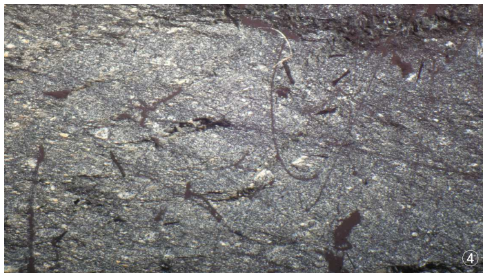
①노두사진 ②위치도 ③샘플사진 ④편광현미경