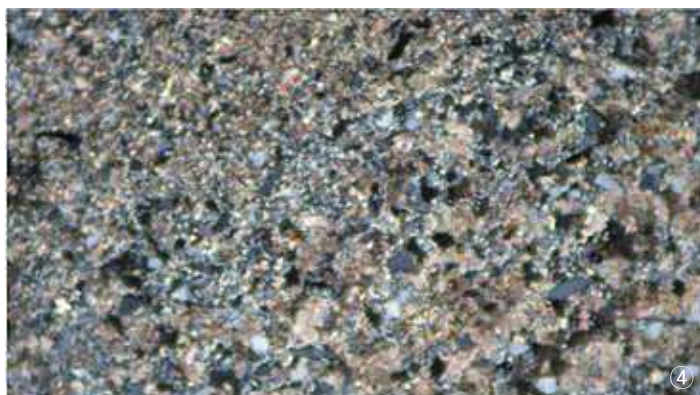
①노두사진 ②위치도 ③샘플사진 ④편광현미경