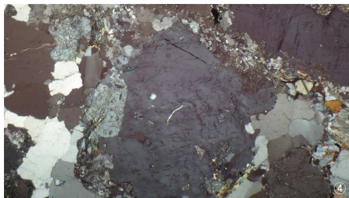
①노두사진 ②위치도 ③샘플사진 ④편광현미경